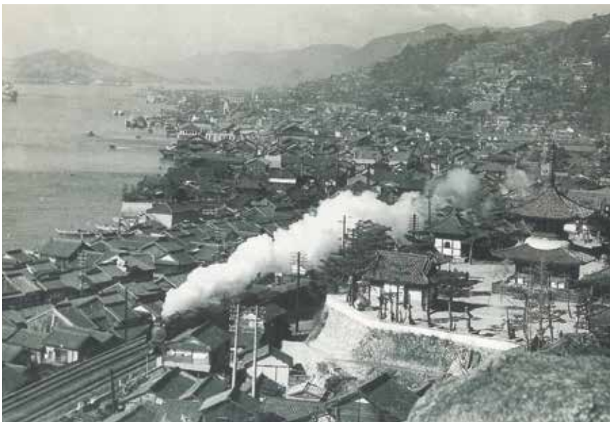
昭和32年(1957)、日暮兵士郎氏撮影(丸善製菓株式会社提供)。

こうして時代毎に揺れ動きながらも、鉄道のある風景は落ち着いた風景へと落ち着いてゆき、尾道水道を行き交う渡船と並び、尾道風景として馴染むものとなった。 小津安二郎の映画「東京物語」でも、その風景が印象的なワンシーンに切り撮られている。 ラストシーンで浄土寺付近を走り抜ける蒸気機関車がそれで、その昔の尾道名所絵葉書にも同様な構図が多々見られる。