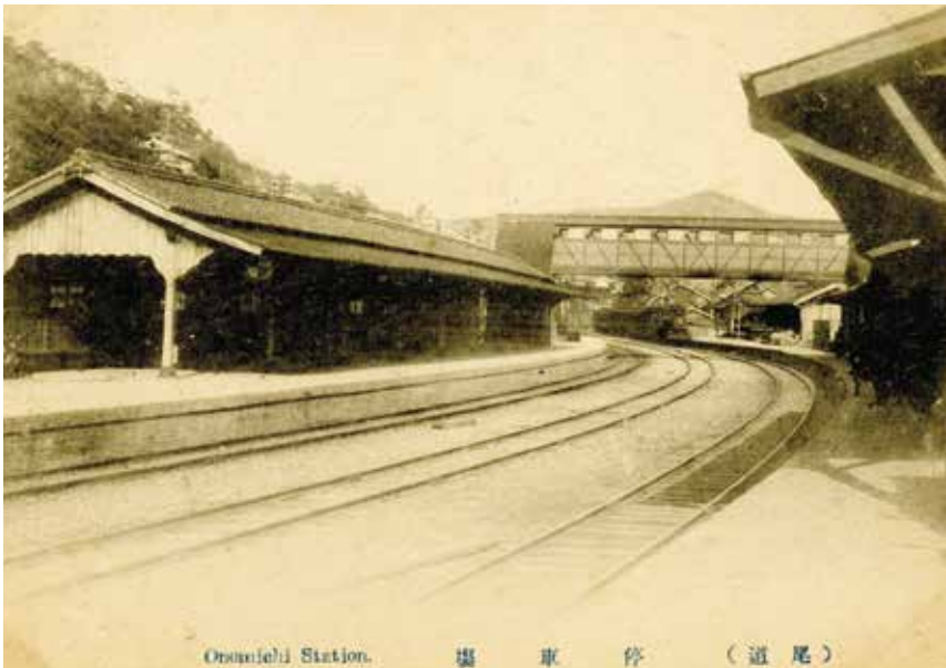
Otsuchi Station. 尾道駅 (道尾) 大正期の尾道駅ホーム。地下道以前の連絡歩道橋が見える。

現代尾道に見た市庁舎問題の比ではない不穏な空気を充満させた鉄道敷設をめぐる経過に、終止符を打ったのは経済界と宗教界の各重鎮だった。