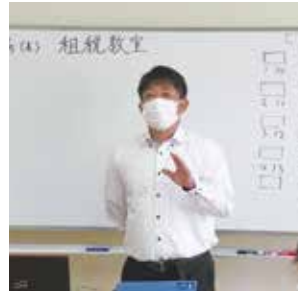
【令和3年度 租税教室開催一覧表】