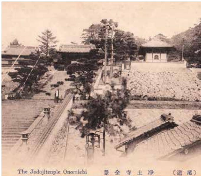
浄土寺参道石段には踏切が設けられ、踏切番の警手が配置された。明治～大正期の風景。

これに該当した参詣道は東から浄土寺、久保八幡神社、浄泉寺、西國寺、常称寺、良神社、天寧寺、信行寺、宝土寺、光明寺、持光寺で、中でも八幡社と常称寺は境内地を貫通している他、信行寺は本堂の移設を余儀なくされた。