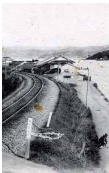
山波のカーブ。単線時代の明治。

敷設者である山陽鉄道会社(国鉄以前の民間会社)も尾道市街地通過が困難となった場合も想定し、高須・西藤から三成へ迂回し、栗原から吉和へ出るルートが描かれた。そのルートで見る尾道駅は新浜ないし吉和南部だった可能性が高い。